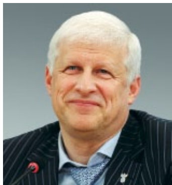
Глава Чеченской Республики Рамзан Кадыров

Сегодня большой футбол пришел в столицу Чеченской Республики, город Грозный! На одном из наиболее современных футбольных стадионов страны – «Ахмат Арена» – состоится товарищеский матч между второй сборной России и сборной Литвы.