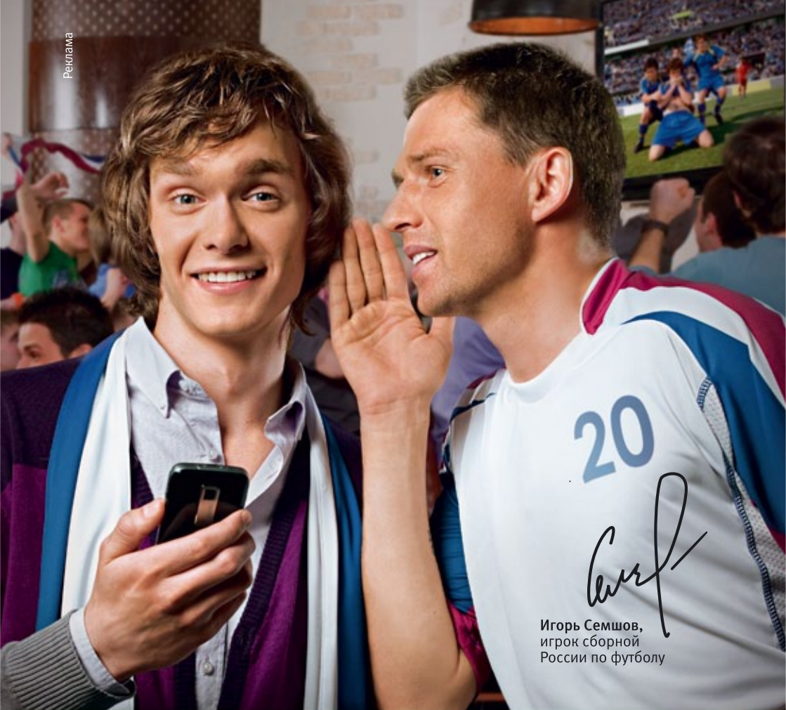
Игорь Семшов, игрок сборной России по футболу